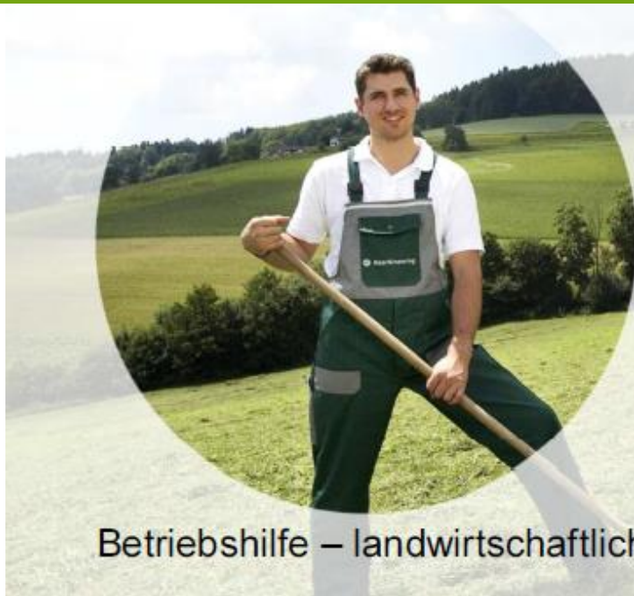
Betriebshilfe – landwirtschaftliches Personal